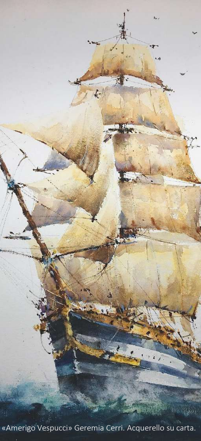
«Amerigo Vespucci» Geremia Cerri. Acquerello su carta.